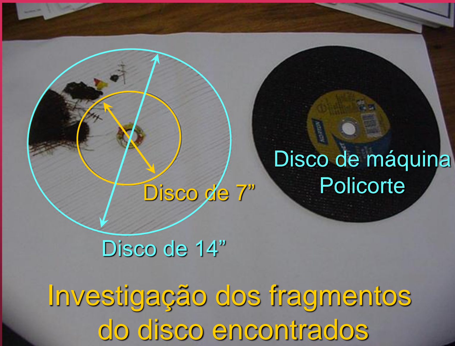
Disco de máquina Policorte